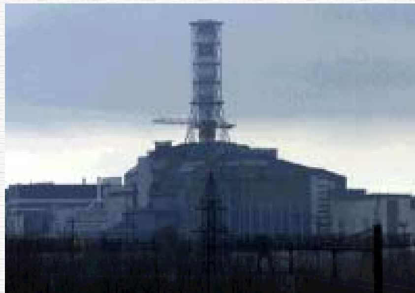
La centrale nucleare di Chernobyl